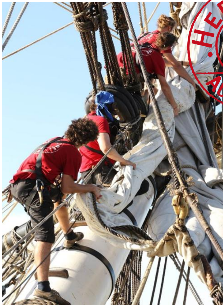
Force du collectif